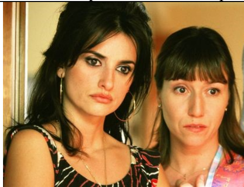
b) Las protagonistas son dos hermanas: Raimunda y Sole.