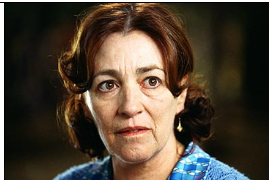
c) Sin embargo, poco después la tía muere y aparece Irene, la madre de Raimunda y Sole.